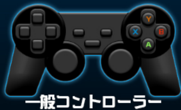
一般コントローラー